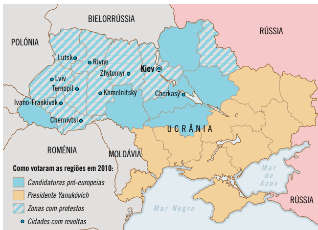
Ucrânia: um país dividido.